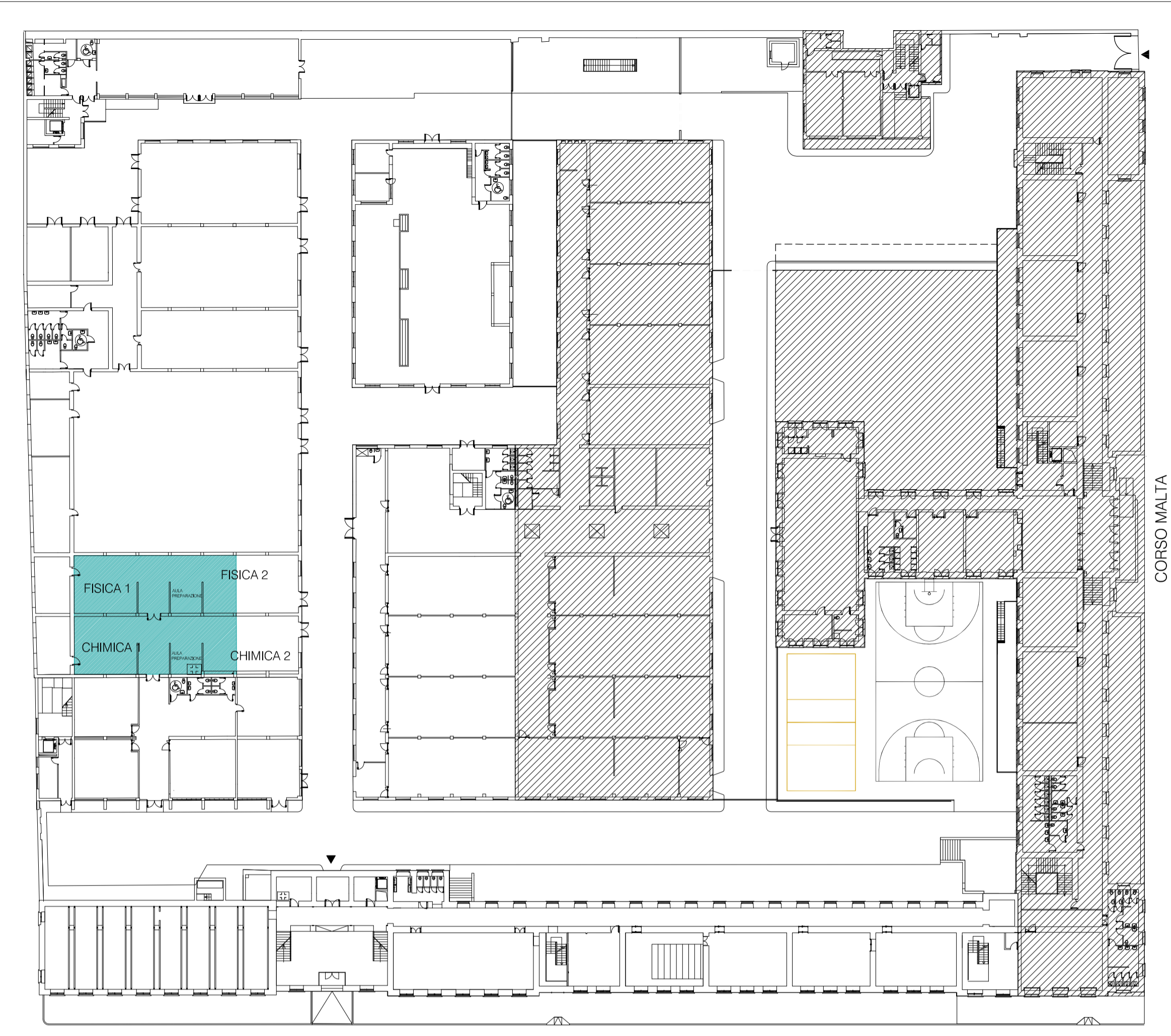
LAYOUT DI INQUADRAMENTO Scala 1:500